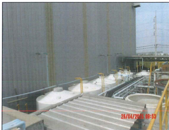
ภาพที่ 2.2-3 ถังรองรับน้ำเสีย