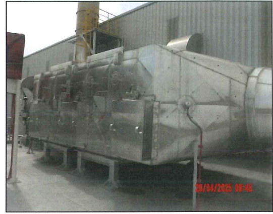
ภาพที่ 2.2-2 ระบบบำบัดอากาศแบบ Selective Catalytic Reduction (SCR)