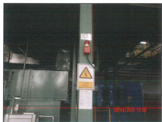
ภายในพื้นที่โครงการ