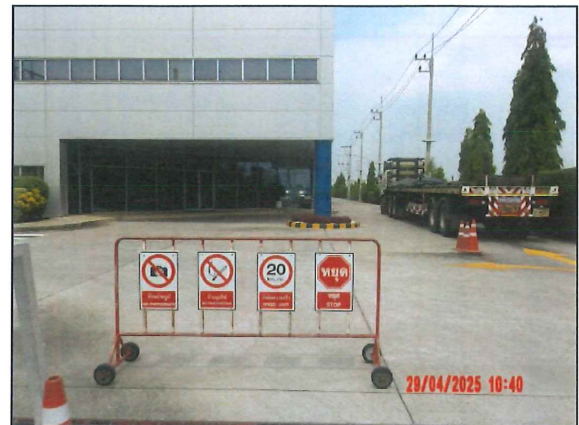
ภาพที่ 2.2-13 ป้ายจำกัดความเร็ว