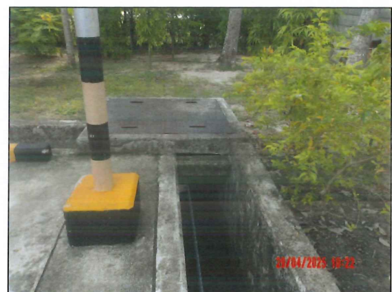
ระบบท่อน้ำเสีย