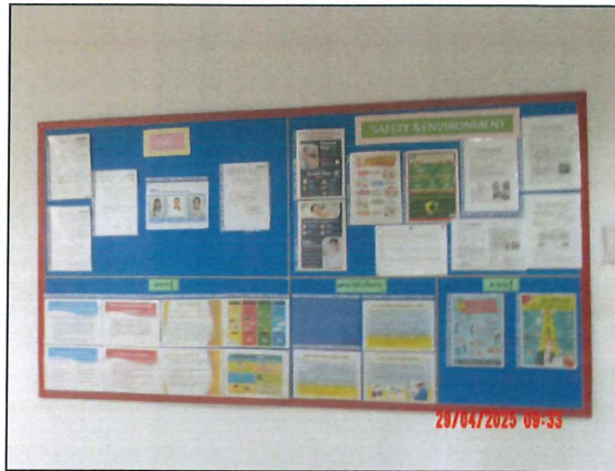
ภาพที่ 2.2-12 บอร์ดประชาสัมพันธ์