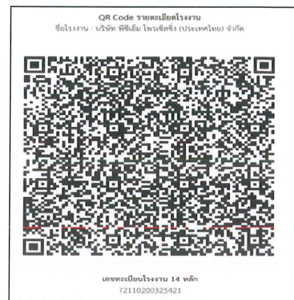
ภาพที่ 2.2-17 ช่องทางการรับเรื่องร้องเรียน (QR CODE) ที่บริเวณด้านหน้าโครงการ