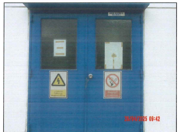
ภายในพื้นที่โครงการ