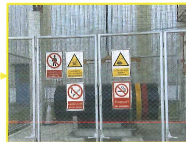
บริเวณถังกักเก็บแอมโมเนีย