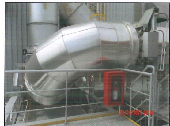
บริเวณระบบบำบัดอากาศแบบ Selective Catalytic Reduction (SCR)