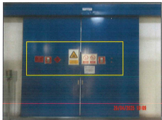
ภาพที่ 2.2-25 ห้องเก็บสารเคมีและป้ายเตือนอันตราย