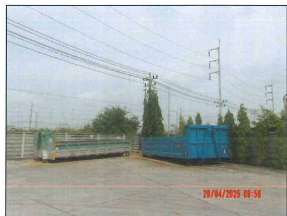
ภาพที่ 2.2-9 พื้นที่รวบรวมกากของเสีย