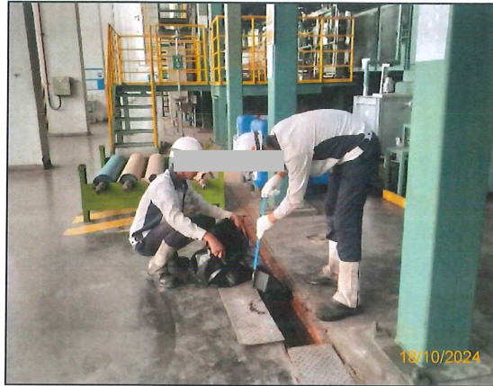
ภาพที่ 2.2-16 การทำความสะอาดรางระบายน้ำ