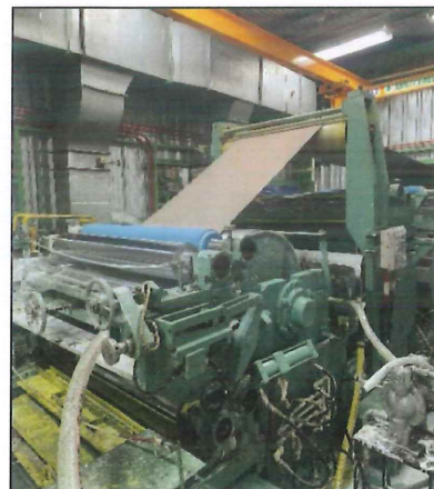
ภาพที่ 2.2-7 กระบวนการเคลือบสีลงแผ่นเหล็ก