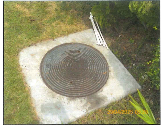
ภาพที่ 2.2-5 ระบบบำบัดน้ำเสียสำเร็จรูป