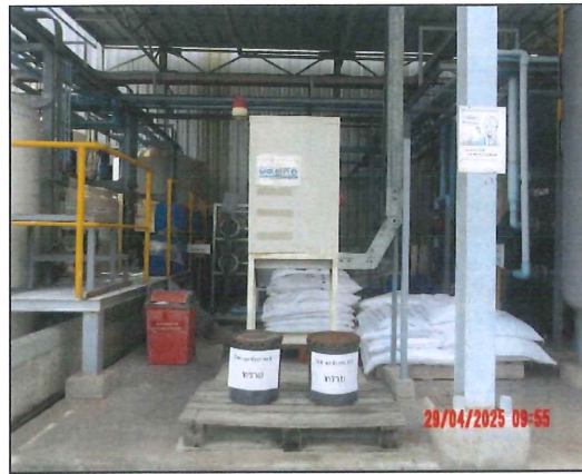
ภาพที่ 2.2-27 วัสดุดูดซับสารเคมี