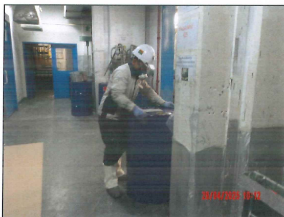
ภาพที่ 2.2-10 พนักงานสวมใส่ PPE