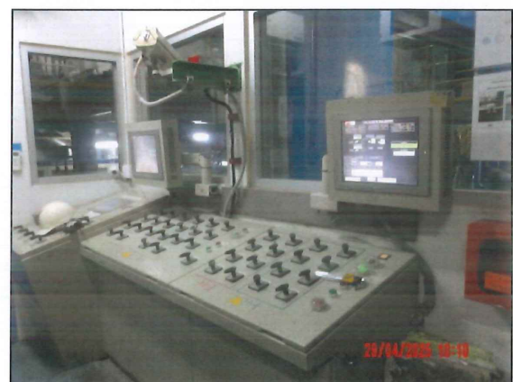
ภาพที่ 2.2-11 Control Room