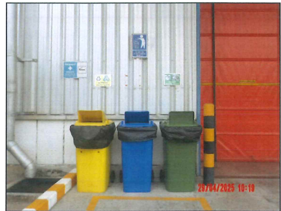
ภาพที่ 2.2-8 ถังขยะแยกประเภท