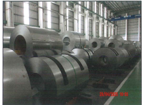
ภาพที่ 2.2-22 พื้นที่เก็บวัตถุดิบและผลิตภัณฑ์