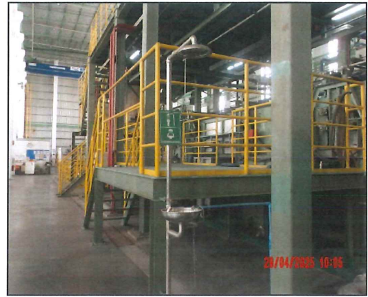
ภาพที่ 2.2-20 ฝักบัวล้างตัวและอ่างล้างตาฉุกเฉิน