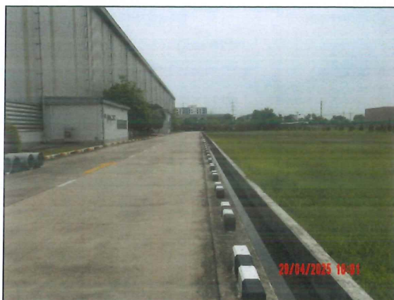
รางระบายน้ำฝน