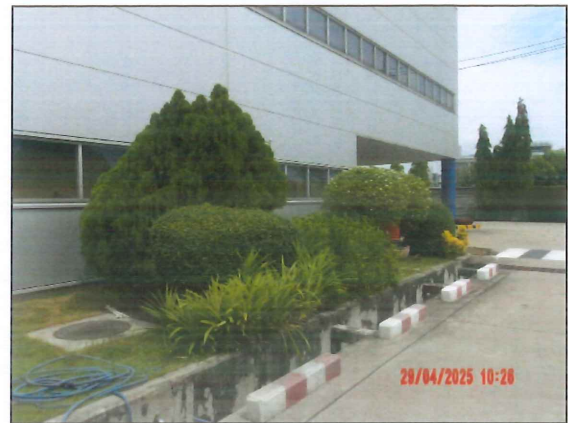
ภาพที่ 2.2-1 พื้นที่สีเขียว