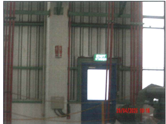
ภาพที่ 2.2-24 ป้ายทางหนีไฟ