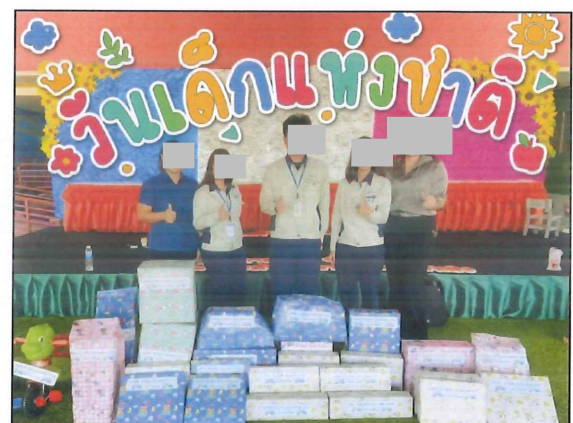
กิจกรรมมอบทุนการศึกษาวันเด็กแห่งชาติที่โรงเรียนบ้านมาบสามเกลียว และมอบของขวัญวันเด็ก ศูนย์พัฒนาเด็กเล็กหนองไม้แดง ในวันเด็กแห่งชาติ ปี 2568 เมื่อวันที่ 11 มกราคม 2567