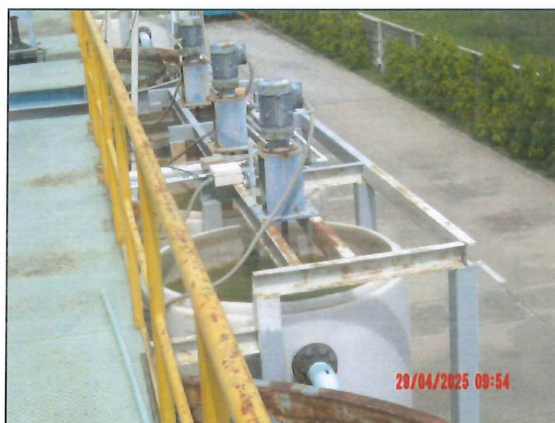
ระบบบำบัดน้ำเสียปนเปื้อนโครเมียม