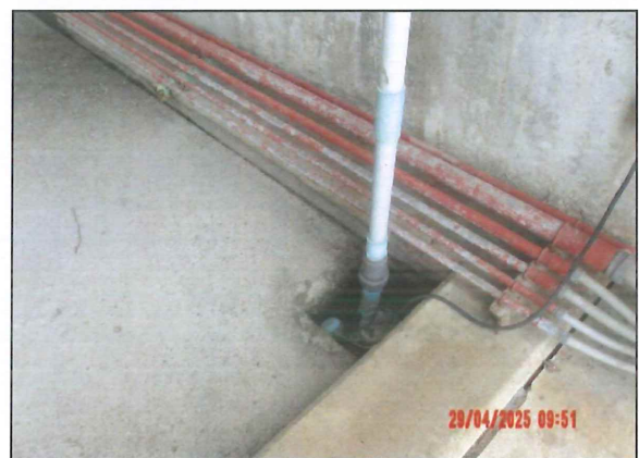
ภาพที่ 2.2-26 บริเวณถังเก็บกรดซัลฟิวริก