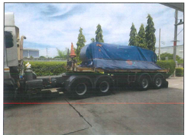
ภาพที่ 2.2-14 การคลุมผ้าใบรถบรรทุก